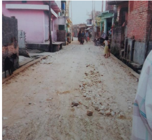
आयोजना निर्माण चरणको अवस्था