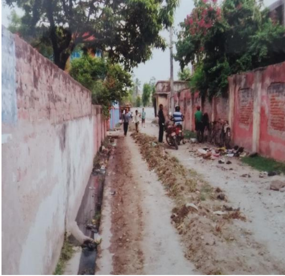
आयोजना शुरुहुनुभन्दा पूर्वको अवस्था