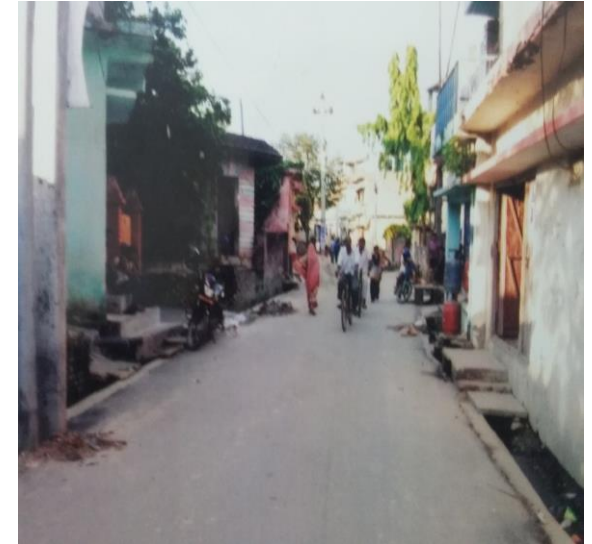
आयोजना सम्पन्न भएपश्चात् को अवस्था