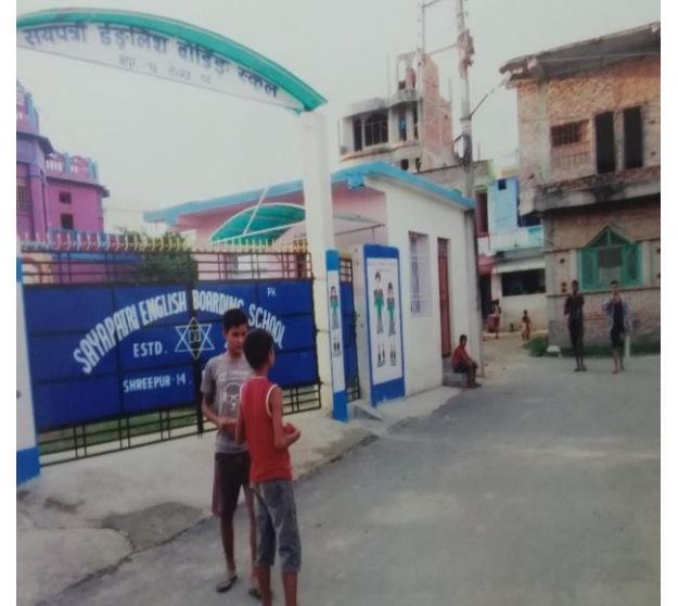
आयोजना सम्पन्न भएपश्चात् को अवस्था