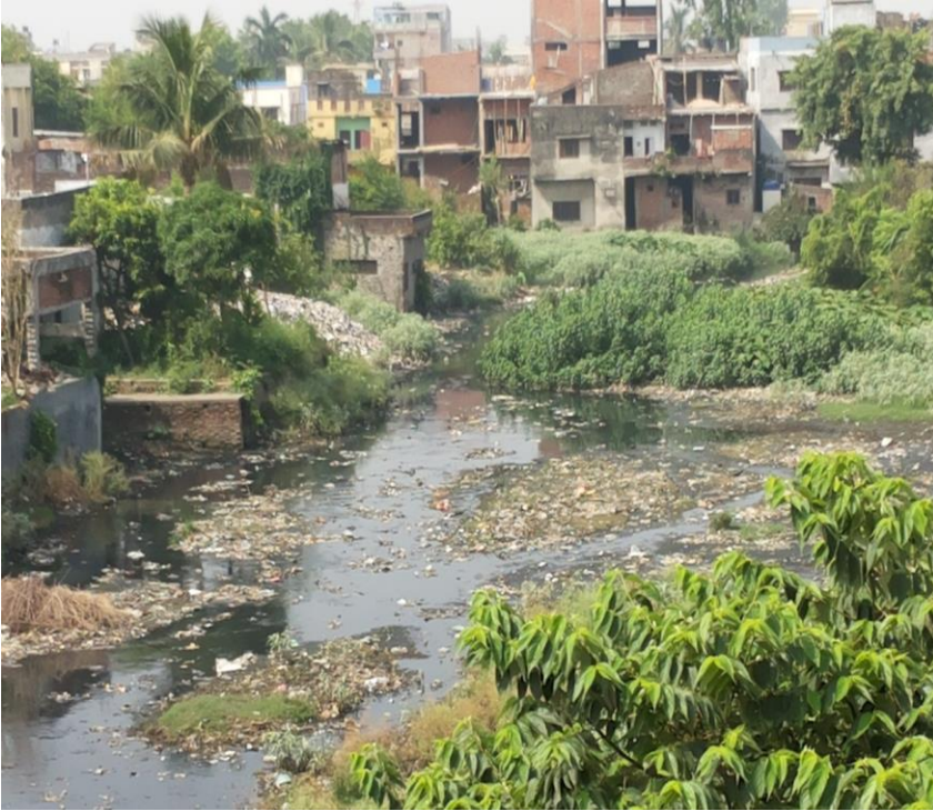
आयोजना शुरुहुनुभन्दा पूर्वको अवस्था

४. मझौला शहर एकिकृत शहरी वातावरणीय सुधार आयोजना अन्तर्गत माईराम पोखरी स्थित निर्माण हुन लागेको रिक्रिएसन पार्क