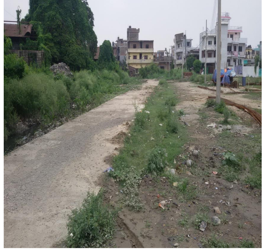
आयोजना सम्पन्न भएपश्चात् को अवस्था