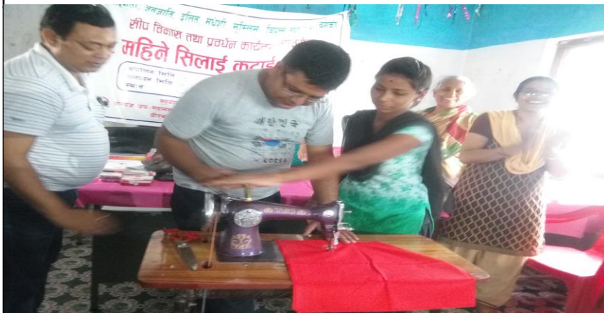
सिप विकास तथा प्रवर्धन कार्यक्रम अन्तर्गत २ महिने सिलाई कटाई कार्यक्रम