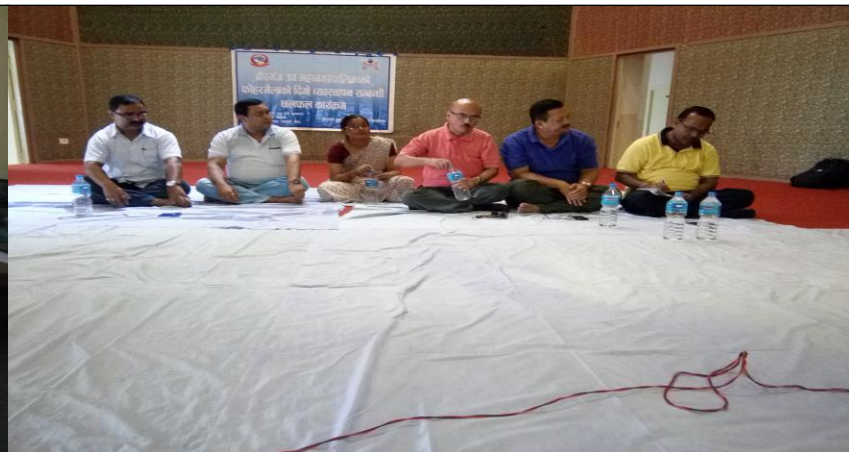
वीरगंज उपमहानगरपालिकाको फोहोरमैलाको दिगो व्यवस्थापनको सम्बन्धि छलफल कार्यक्रम