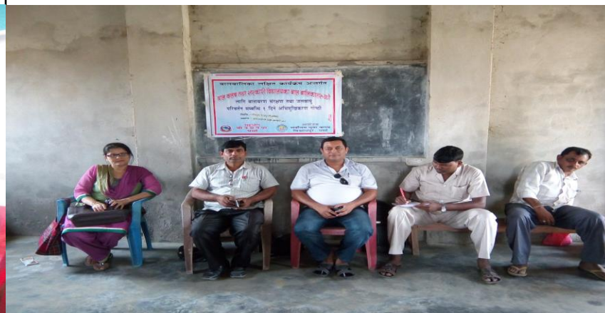
बालबालिकाहरूको लागि वातावरण संरक्षण तथा जलवायु परिवर्तन सम्बन्धि अभिमुखिकरण गोष्ठी