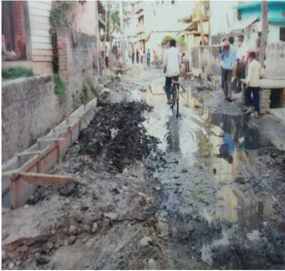
आयोजना शुरुहुनुभन्दा पूर्वको अवस्था

२. बडा नं. १४ कृषि अनुसन्धान देखि मस्जिद हुदै तिनपेडिया चौक सम्म