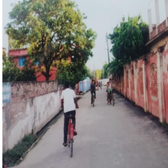
आयोजना सम्पन्न भएपश्चात् को अवस्था