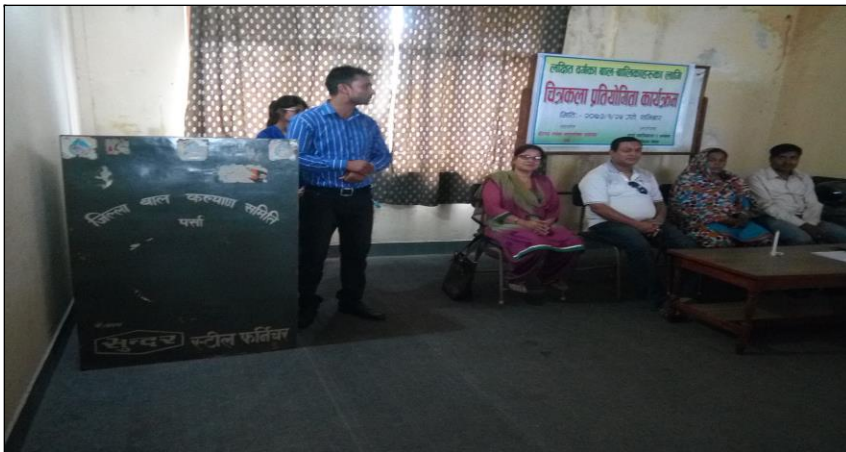
लक्षित वर्गका बाल-बालिकाहरूको लागि चित्रकला प्रतियोगिता कार्यक्रम