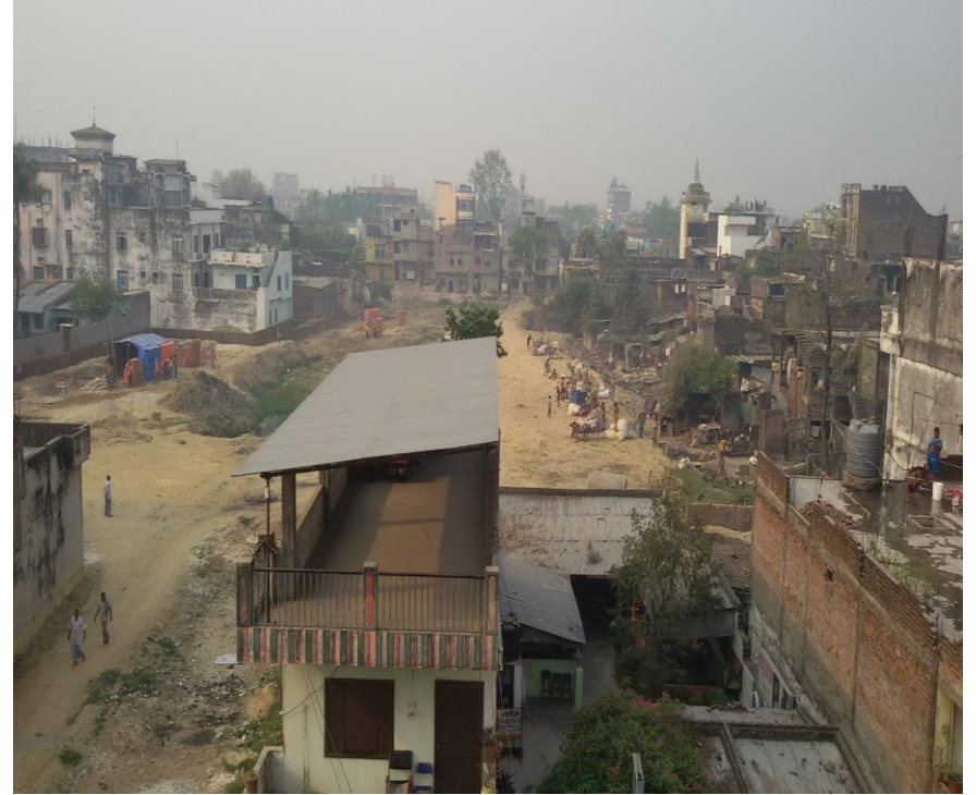
आयोजना १०% सम्पन्न भएपश्चात् को अवस्था