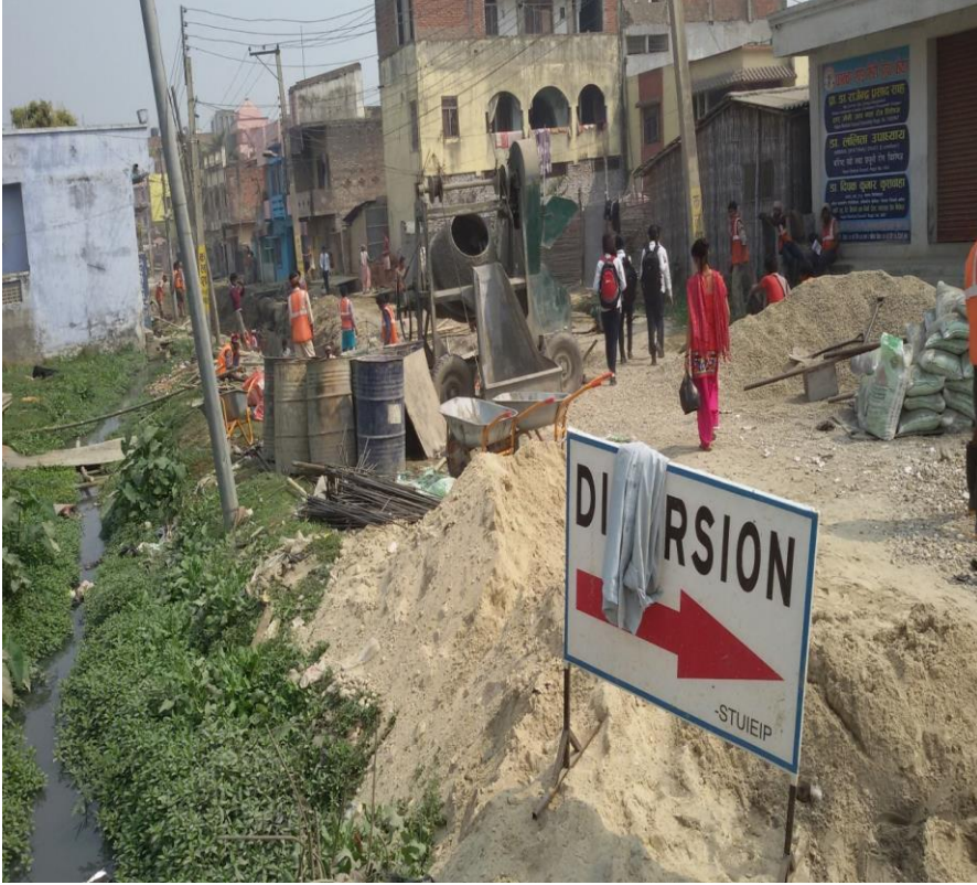
आयोजना शुरुहुनुभन्दा पूर्वको अवस्था